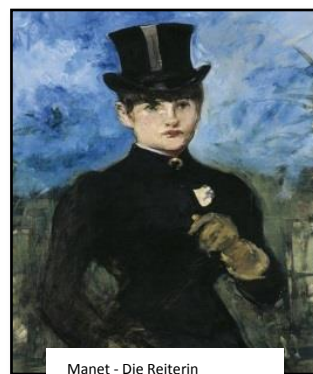
Manet - Die Reiterin